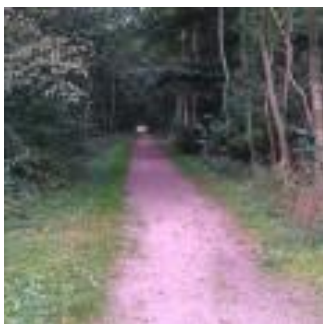
Jernbanestrækning mod Odense, som den ser ud i